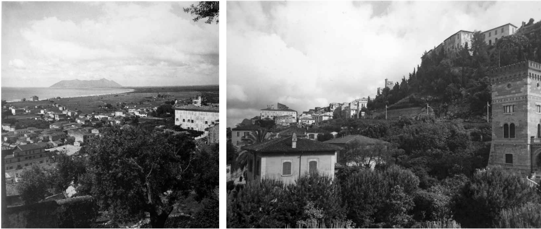
Fig. 1 La nuova espansione della città di Terracina con il monte Circeo sullo sfondo vista dal Parco della Rimembranza; il Convento di San Francesco e il parco della Rimembranza (Roma, Archivio di Giuseppe Zander).