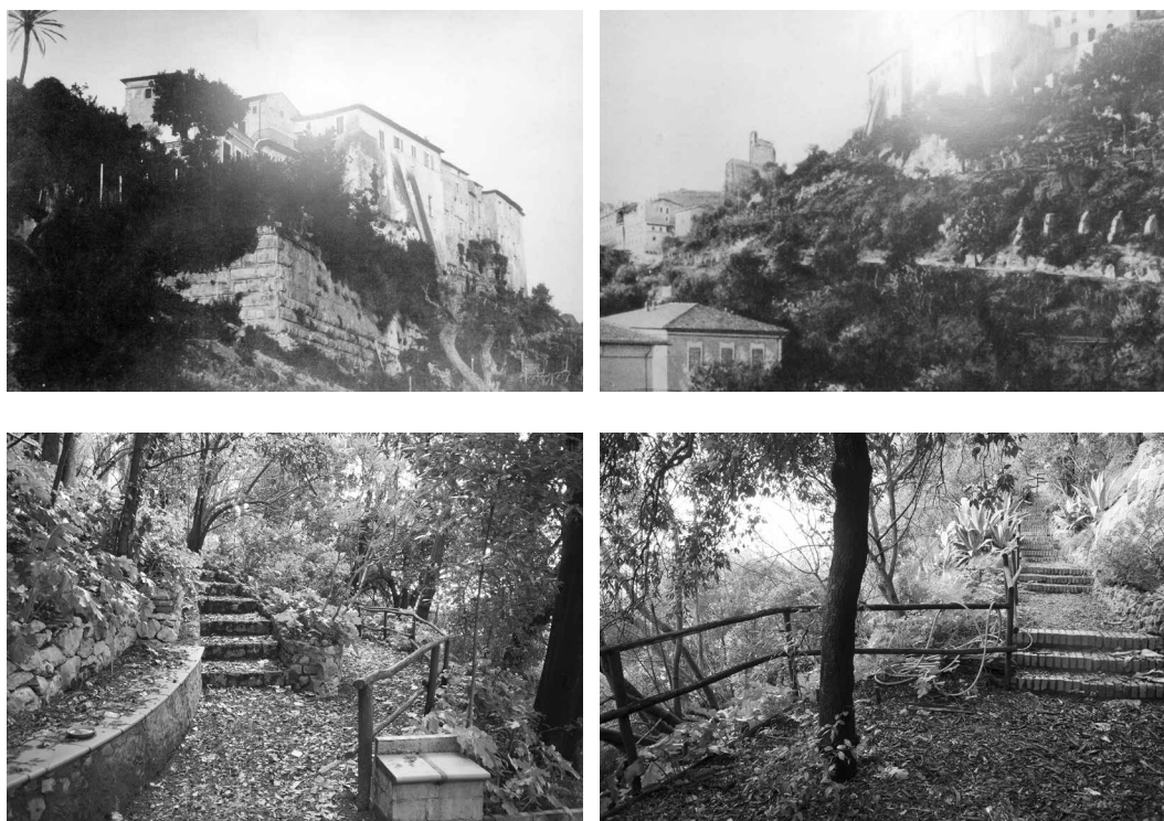
Fig. 3 Vedute fotografiche dei resti archeologici nel parco; a sinistra il muro sostruttivo in opera quadrata; a destra il pendio con i resti delle concamerazioni romane, 1920 ca..