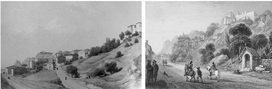
Fig. 2 Vedute della salita alla città alta, l'area del parco e il Convento di San Francesco. A sinistra, Anonimo, incisione acquarellata, s.d., (collezione privata); a destra William Brockendon, incisione, da Road book London-Naples, 1835.