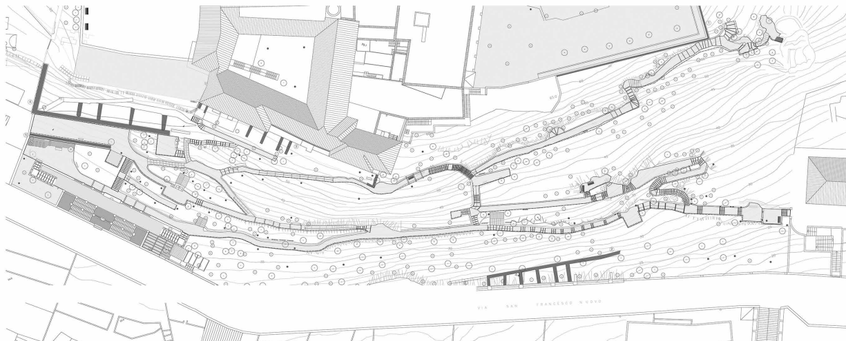
Fig. 6 Rilievo della consistenza e dello stato di conservazione dei percorsi all'interno del Parco della Rimembranza (elaborazione grafica degli studenti del corso di Laboratorio di Restauro, 2015).

te distinte per genere e dimensioni, e ad ogni tipologia è stato attribuito un simbolo grafico combinato con un colore. Il risultato ottenuto rappresenta un tassello conoscitivo che, assieme ai risultati delle altre analisi, contribuisce alla ricostruzione della storia del parco (Fig. 7).