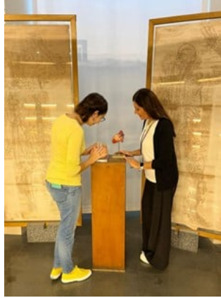
Fig. 1: Dottorande impegnate nell'allestimento del percorso tattile nella sala di Anatomia nel museo di Mirabilia.

coinvolti grazie all'iniziativa delle Giornate FAI per le Scuole promossa dall'associazione Fondo Ambiente Italiano (figg. 2-3).