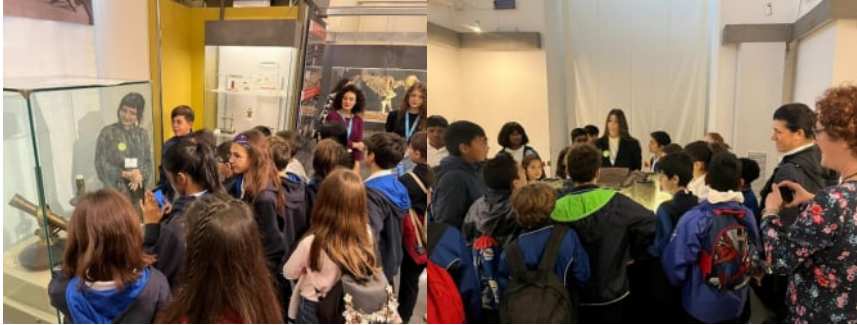
Fig. 2-3: Apprendisti Ciceroni del Liceo Artistico "Emilio Greco" conducono le visite guidate spiegando le sale delle collezioni e dei plastici agli studenti più piccoli.

coinvolti grazie all'iniziativa delle Giornate FAI per le Scuole promossa dall'associazione Fondo Ambiente Italiano (figg. 2-3).