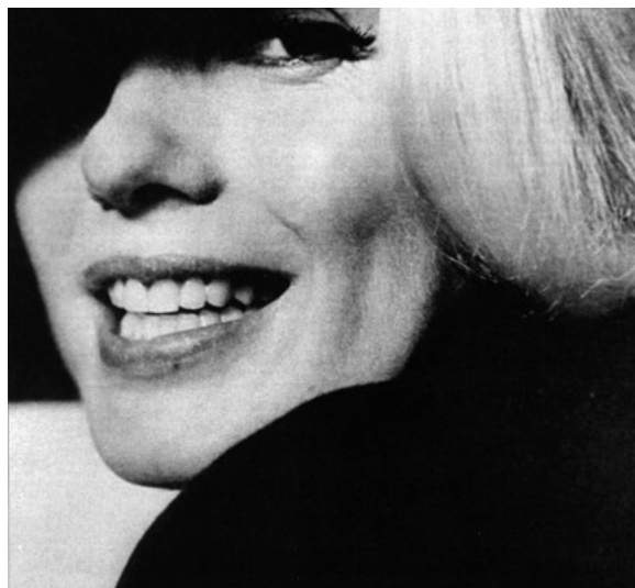
Fotogramma de 'La Sequenza di Marilyn' nel film La rabbia di Pier Paolo Pasolini, 1963

Sulle dolenti note dell' Adagio in Sol minore , apprendiamo che con lei sparì anche il mondo antico di cui era espressione addolcita.