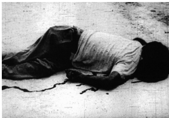
Fotogramma della sequenza sulla Rivoluzione cubana nel film La rabbia di Pier Paolo Pasolini, 1963

Il testo verbale e quello visivo sembrano adesso muoversi all'unisono verso un progressivo disvelamento della pura realtà che giace al fondo di ogni conflitto, nascosta dietro i resoconti adulterati dell'informazione convenzionale. La demistificazione degli