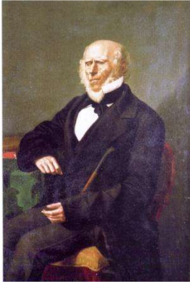
Vincenzo Tedeschi , s.a. e s.d., olio su tela (proprietà Università degli Studi di Catania)