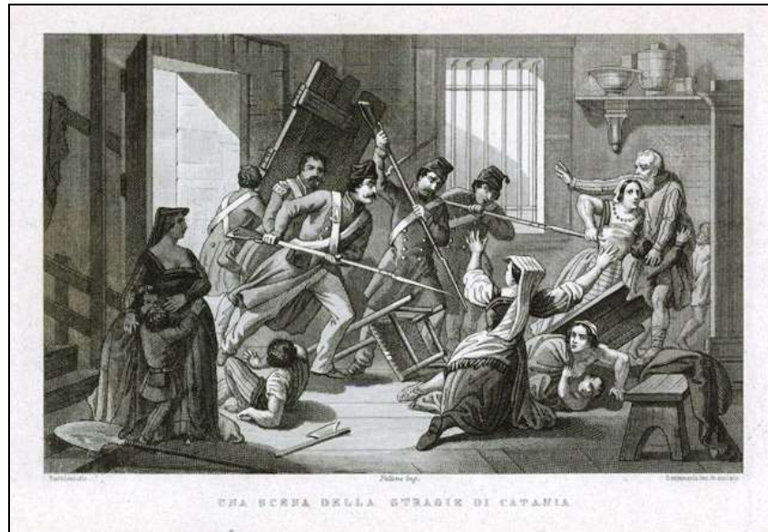
Una scena della strage di Catania, s.d. (ma 1860 ca)

Barbieri dis., Santamaria inc. in acciaio, cm 10x15