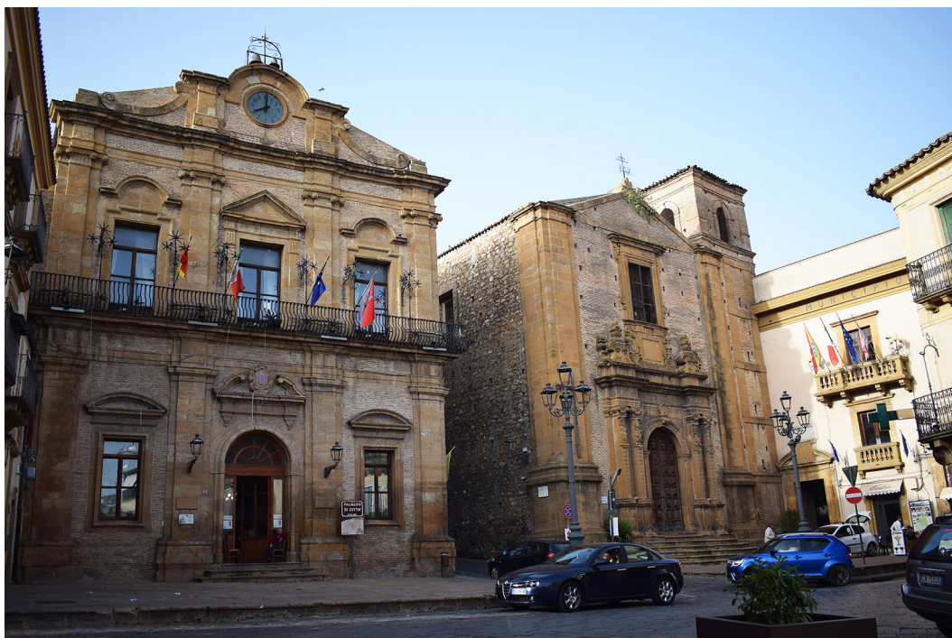
3. Piazza Armerina. Piazza Garibaldi: Palazzo di Città (a sinistra), chiesa di San Rocco (al centro) e “fabbricato Fundrò” (a destra).

è separata da quest’ultimo da una strada che conduce direttamente alla cattedrale 6 [Fig. 2: 4]. Il caso di Piazza Armerina appare dunque significativo nella geografia istituzionale della ‘giovane nazione’, e dell’entroterra siciliano in particolare, tanto per la scelta politica di sdoppiare le sedi municipali – una rappresentativa, l’altra pratico-funzionale – quanto per l’idea architettonica di recuperare e rifunzionalizzare edifici ereditati dal passato, opportunamente risemantizzati con modalità che coinvolsero anche lo spazio urbano circostante 7 .