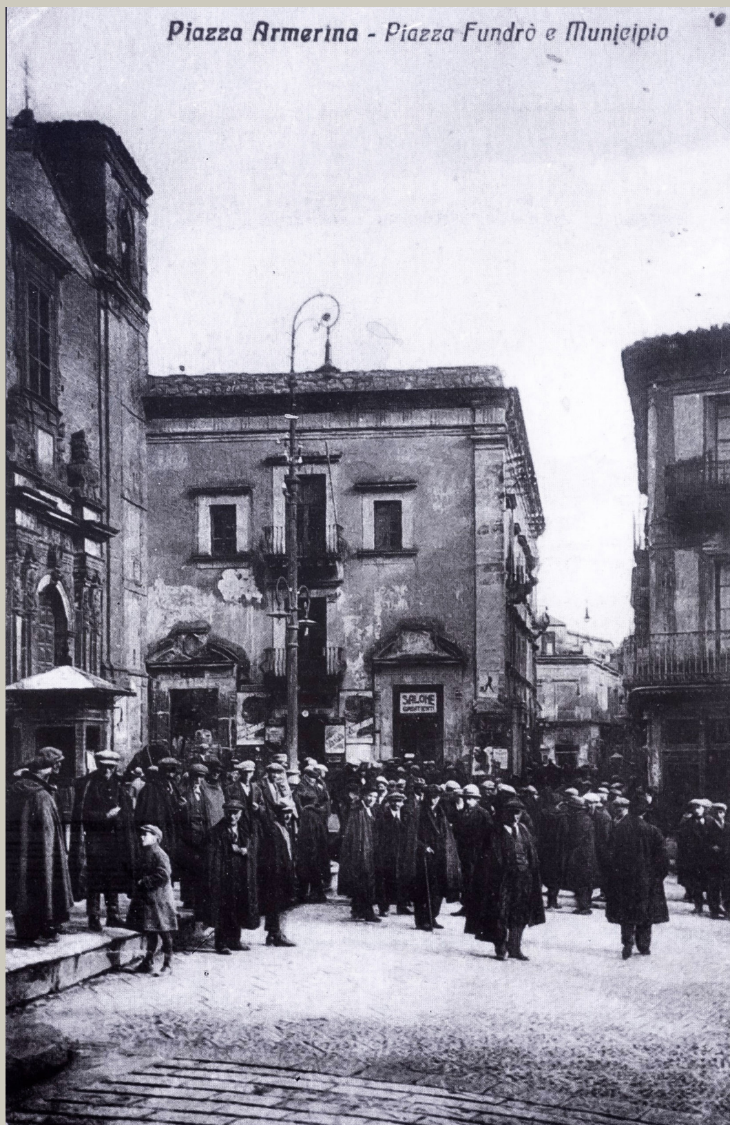
1. Piazza Armerina. Piazza Fundrò e municipio: cartolina, 1920 ca. (Piazza Armerina: fotografie della prima metà del secolo, Piazza Armerina, Immagica, 1987, 27).