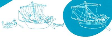
Relitto di Punta Licosa (prima metà del I secolo a.C.)