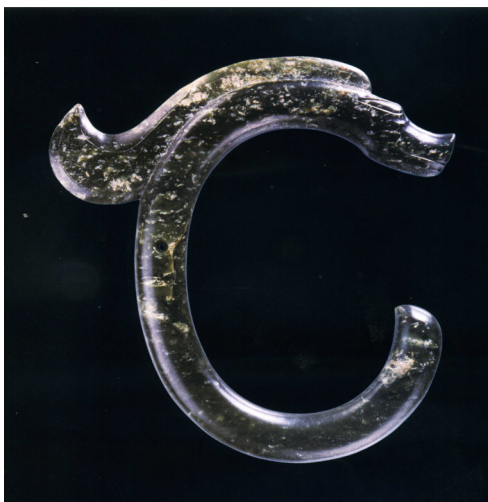
Fig. 3 Drago-cavallo, giada, Cultura Hongshan, Sanxingtala