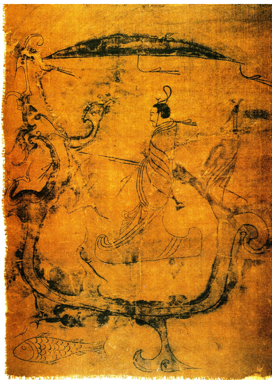
Fig.6 Seta dipinta di Zidanku (Changsha, Hunan) III sec. a.C.

A seguito della fondazione dell'impero, durante la dinastia Han, il culto dell'aldilà assume dei connotati senza precedenti e il long , oltre ad essere un intermediario