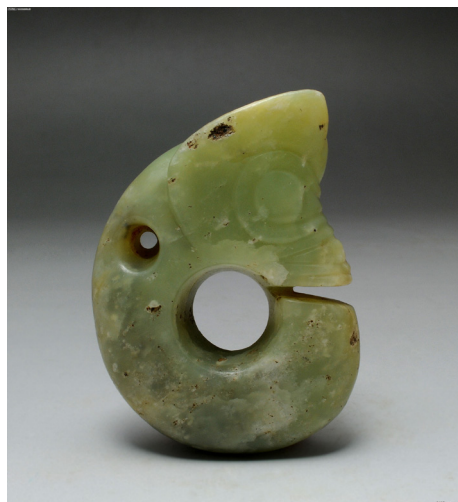
Fig. 2 Zhulong, giada, Cultura Hongshan, Liaoning, 3500 a.C.

Nella Cina centrale dove sembra prevalere la versione del "pesce-cocodrillo-serpente" è stata scoperta un'altra tra le più antiche raffigurazioni di proto- long . Nella tomba M45 di Puyang, Xishui (Henan), della cultura Yangshao 仰韶, da-