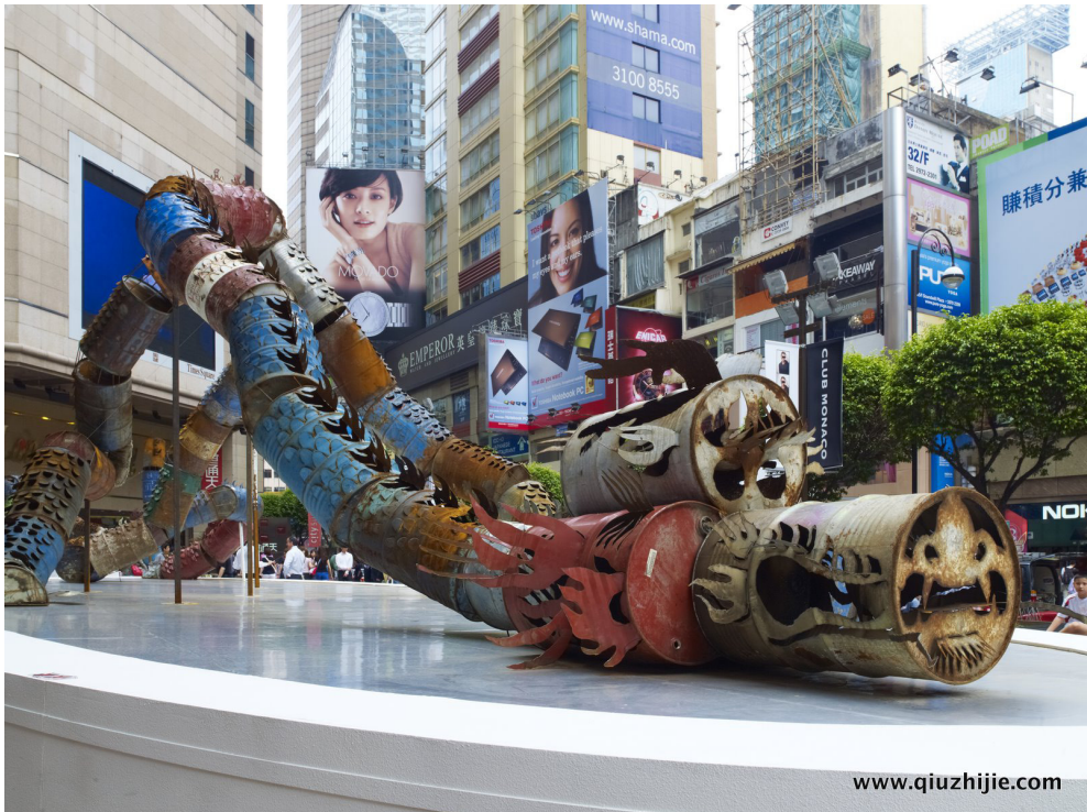
Fig.9 Qiu Zhijie (Fujian, 1969), Oil Cans Dragon , 2011

Solo superando i confini dell'immaginario collettivo occidentale e lungi dal voler essere uno stereotipo ingabbiato in formule preconcepite e generalizzanti, il long riacquista così tutta la sua complessa identità.