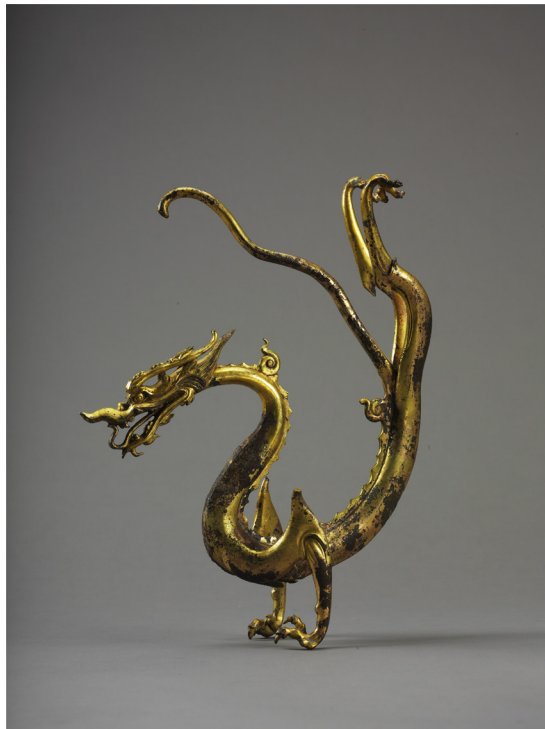
Fig.8 Long, bronzo dorato, epoca Tang (618-907)

La molteplicità di significati di cui è stato investito sin dall'antichità, induce ad adottare un approccio differenziato nei confronti del suo ruolo all'interno della società cinese. Nella religiosità popolare fu soprattutto il benefico apportatore di pioggia, presso la corte imperiale fu il simbolo del potere, per gli adepti del taoismo e del buddhismo e dei loro successivi culti sincretici (primo fra tutti il buddhismo chan ), divenne il simbolo della illusoria realtà apparente, dietro cui si celava la vera conoscenza: come un rocambolesco gioco di specchi, ogni valenza non ha escluso