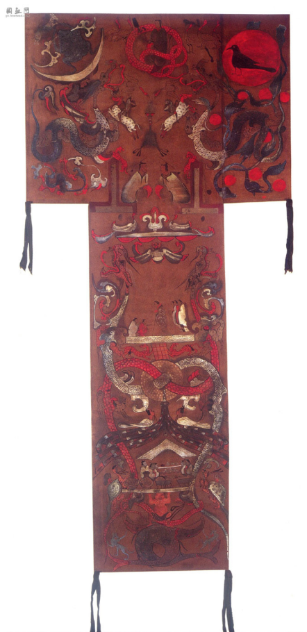
Fig.7 Stendardo in seta, II sec. a.C. Mawangdui, Hunan

La sua forma, che differisce leggermente, a seconda del materiale usato per la