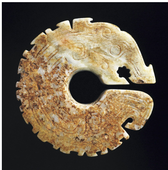
Fig. 5 Long, giada, tomba di Fu Hao, 1200 a.C., Shang, Yinxu, Henan

Associato ai potenti fenomeni della natura come il vento, la pioggia, il tuono e il fulmine, il long pare rafforzare i propri connotati riferibili al cielo: oltre a dare il nome ad una costellazione, in un cofanetto laccato del V sec. a.C. rinvenuto nella tomba del Marchese Yi di Zeng ( Zeng hou Yi 曾侯乙, Leigudun, Hunan), l’animale