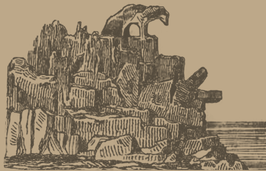
Veduta generale di Capo dell'Orso . A. La Marmora, Voyage en Sardaigne .