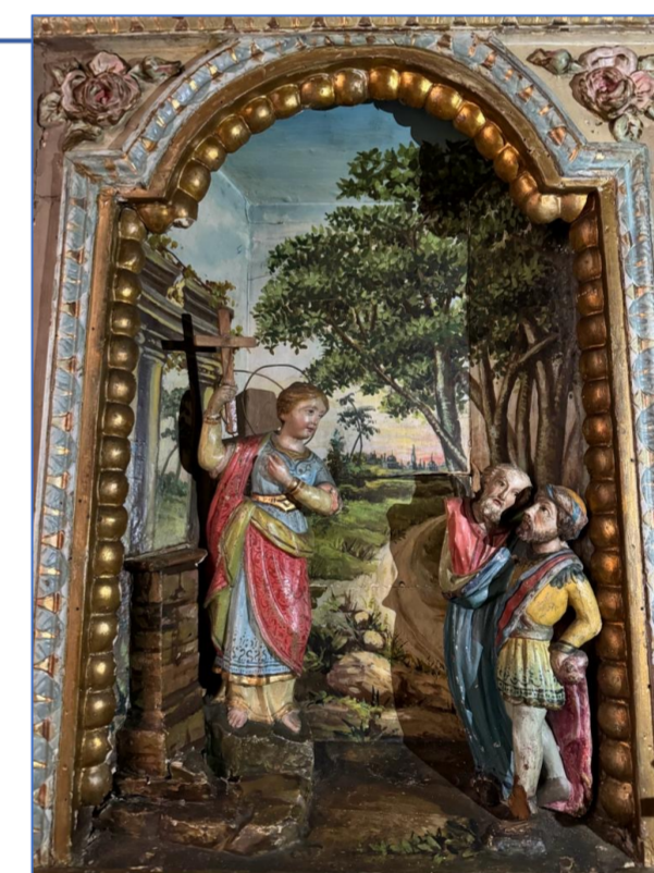
Particolare della candelora dei falegnami: Bottega acese, S. Venera, sec. XIX, Legno scolpito, dipinto. Acireale, Chiesa S.Rocco.

La memoria culturale è iscritta in questi elementi che ricostituiscono antiche botteghe artigianali come quelle degli argentieri, scomparse da più di un secolo e mezzo, o quelle scultoree, dei panettieri, calzolari, pescatori, muratori ormai al tramonto per via della produzione industriale. Esse costituiscono la memoria sociale in cui la comunità si riconosce poiché attorno al culto di S. Venera, patrona di Acireale, ruotano quelle che erano le attività commerciali della giovane Città, che emergeva nella Terra di Aci grazie alla ricchezza derivante dalla laboriosità dei suoi abitanti.