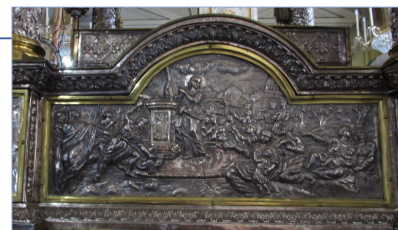
Particolare del Fercolo, Argentiere messinese, L'evangelizzazione della Santa, 1724, Argento sbalzato, cesellato. Acireale, Cattedrale.