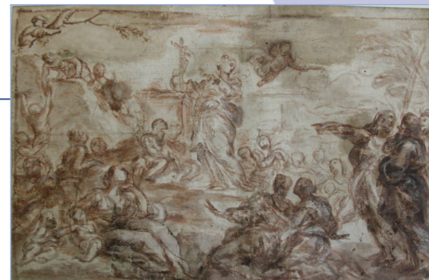
Antonio Filocamo, Disegno eseguito a penna, matita rossa e acquerello bruno su carta bianca di mm 130 x 200. Acireale, Pinacoteca Zelantea.