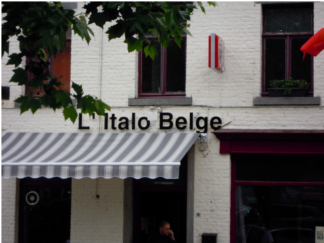
Fig. 6. Ristorante italiano a Morlanwelz, giugno 2012.