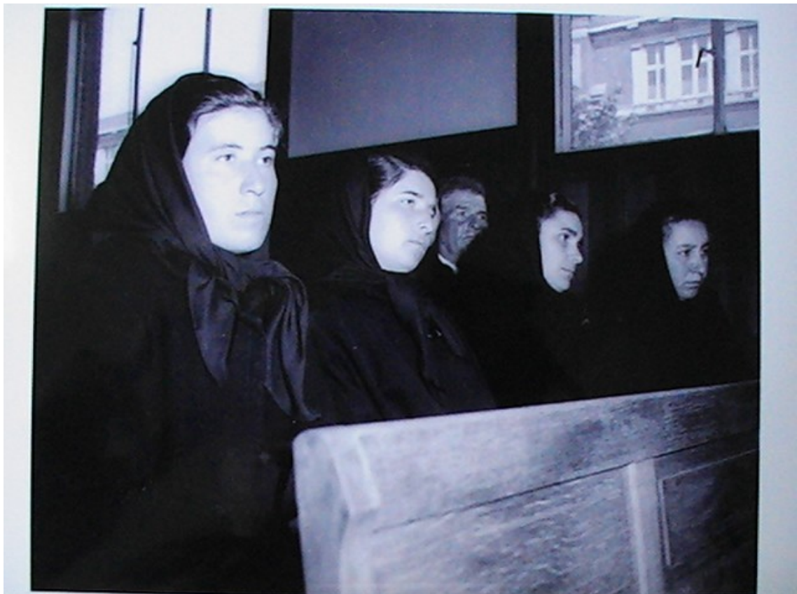
Fig. 2. Vedove durante il processo del Bois du Cazier, foto dell'archivio privato di Jaques Moins.