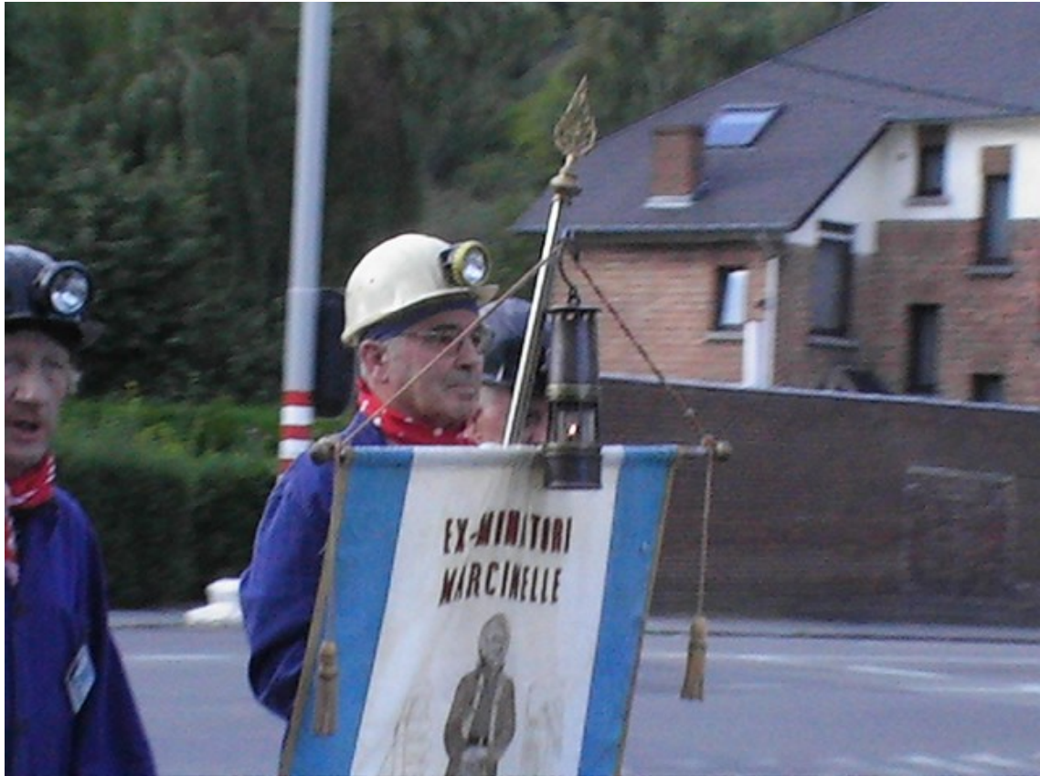
Fig. 15. Commemorazione per la catastrofe di Marcinelle, 8 agosto 2011.