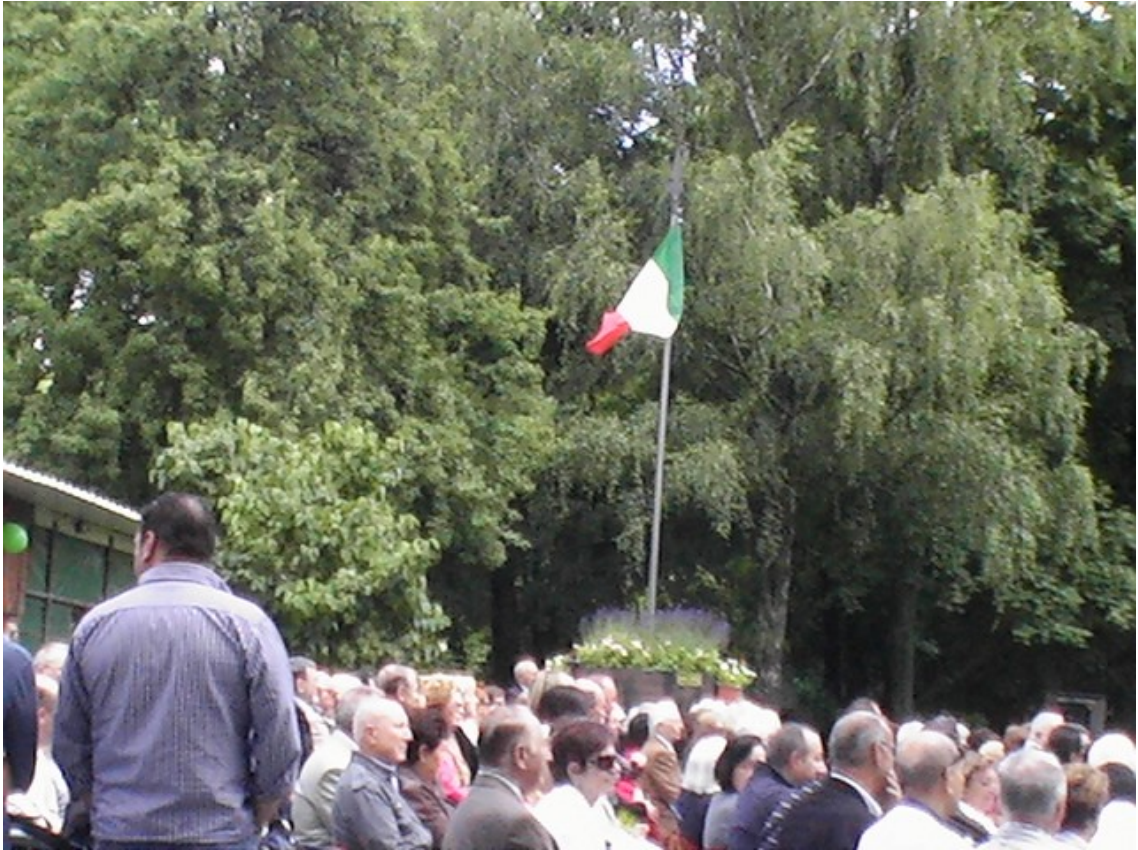
Fig. 10. Centro sociale Cristiano di Roccourt, celebrazione domenicale. Giugno 2012.