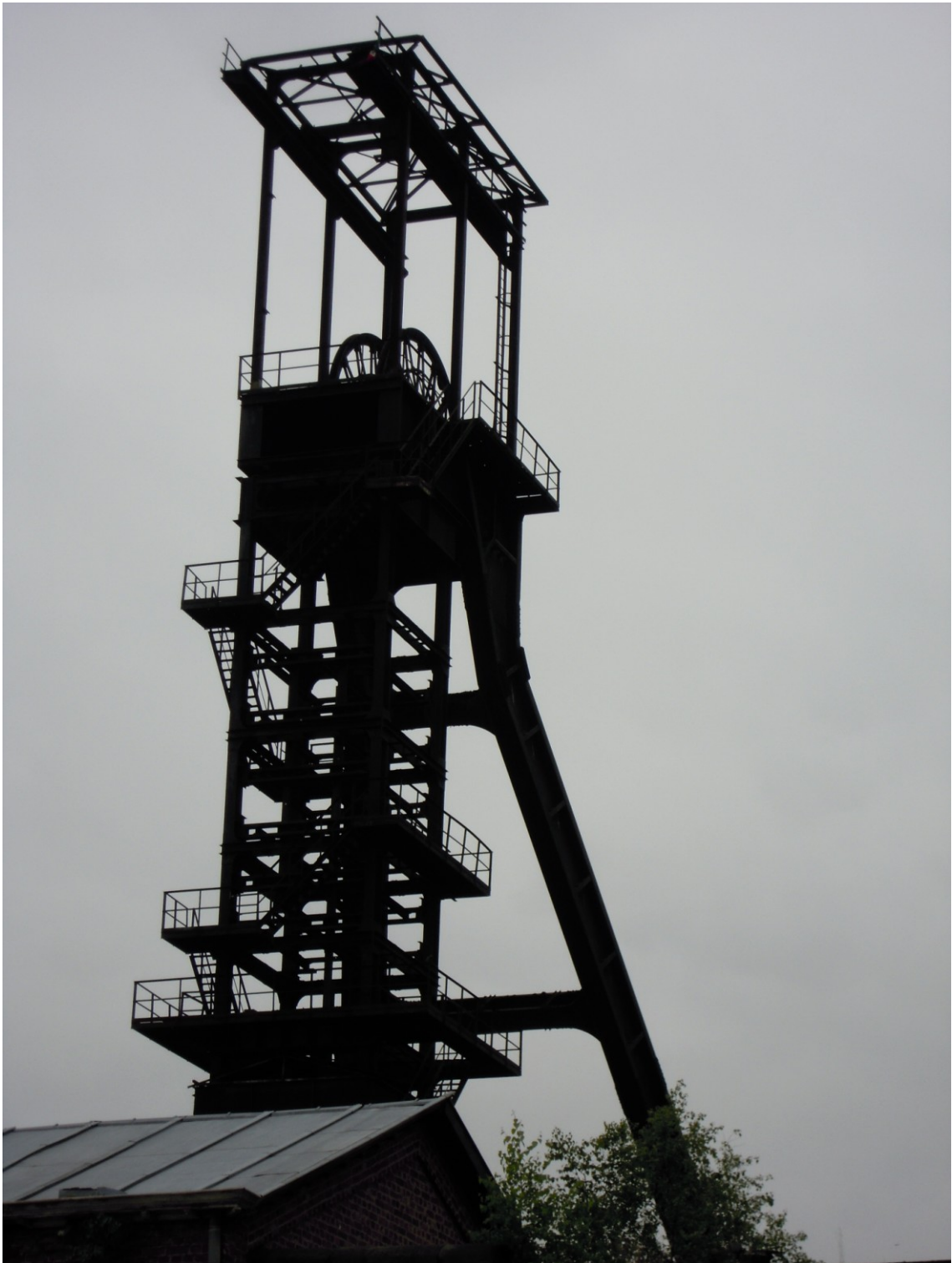
Fig. 7. Torre dell'ascensore della miniera di Morlanwelz, giugno 2012.