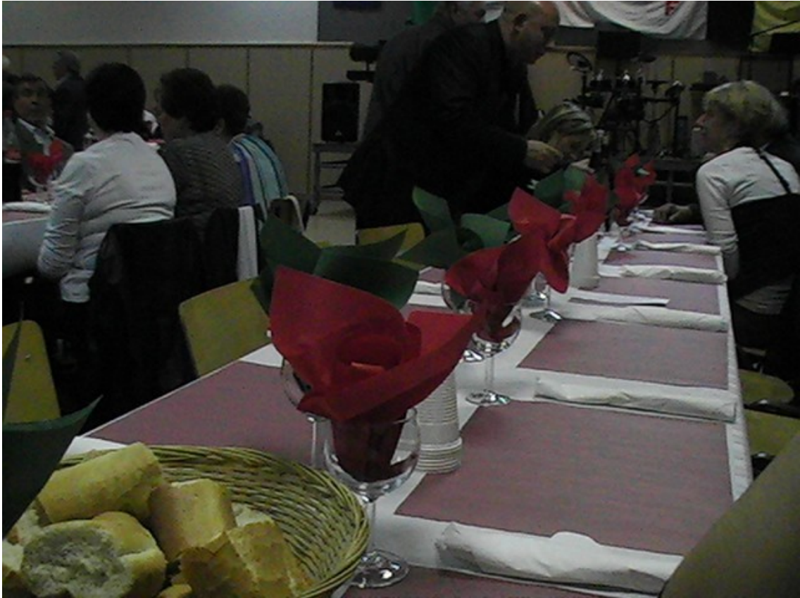
Fig. 9. Festa dell'associazione Usef di Seraing, raccolta fondi per la squadra di calcetto del paese. Sala comunale di Saint Nicholas, giugno 2012.