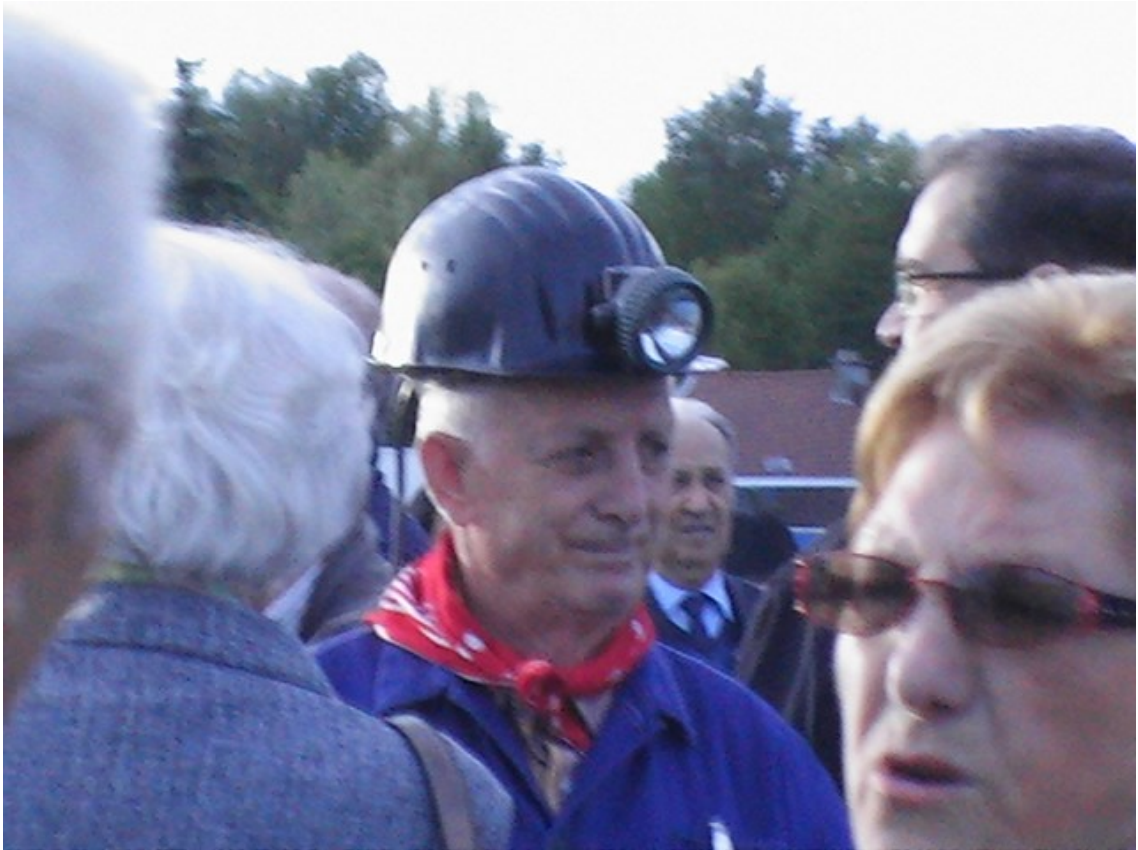
Fig. 14. Commemorazione per la catastrofe di Marcinelle, 8 agosto 2011.