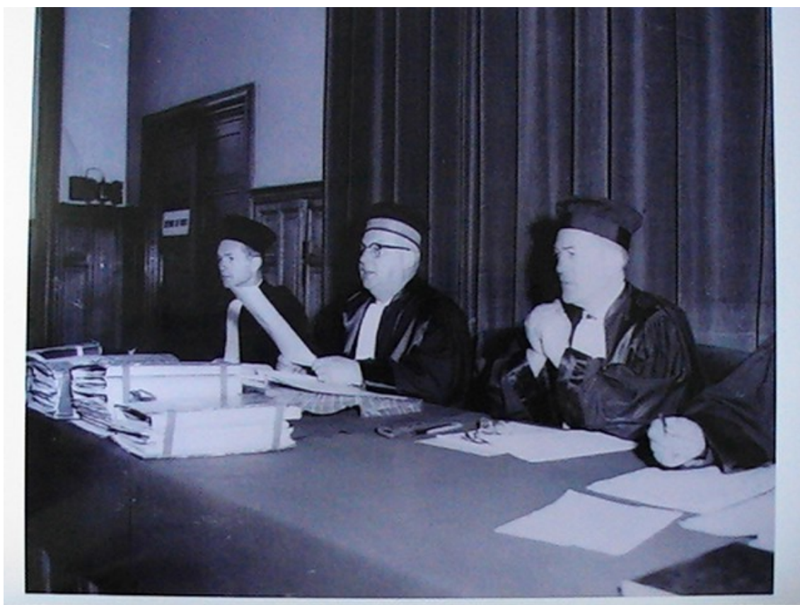
Fig. 4. I giudici durante il processo del Bois du Cazier, foto dell'archivio privato di Jaques Moins.