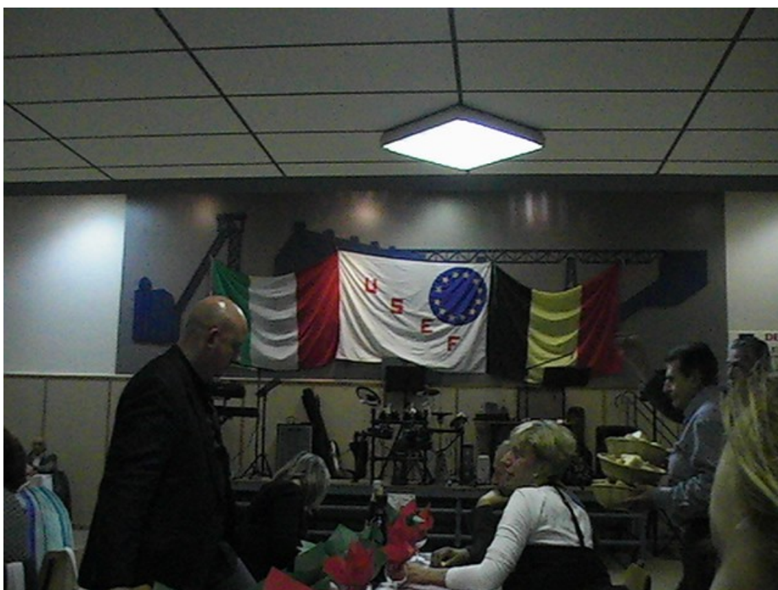
Fig. 8 Festa dell'associazione Usef di Seraing, raccolta fondi per la squadra di calcetto del paese. Sala comunale di Saint Nicholas, giugno 2012.