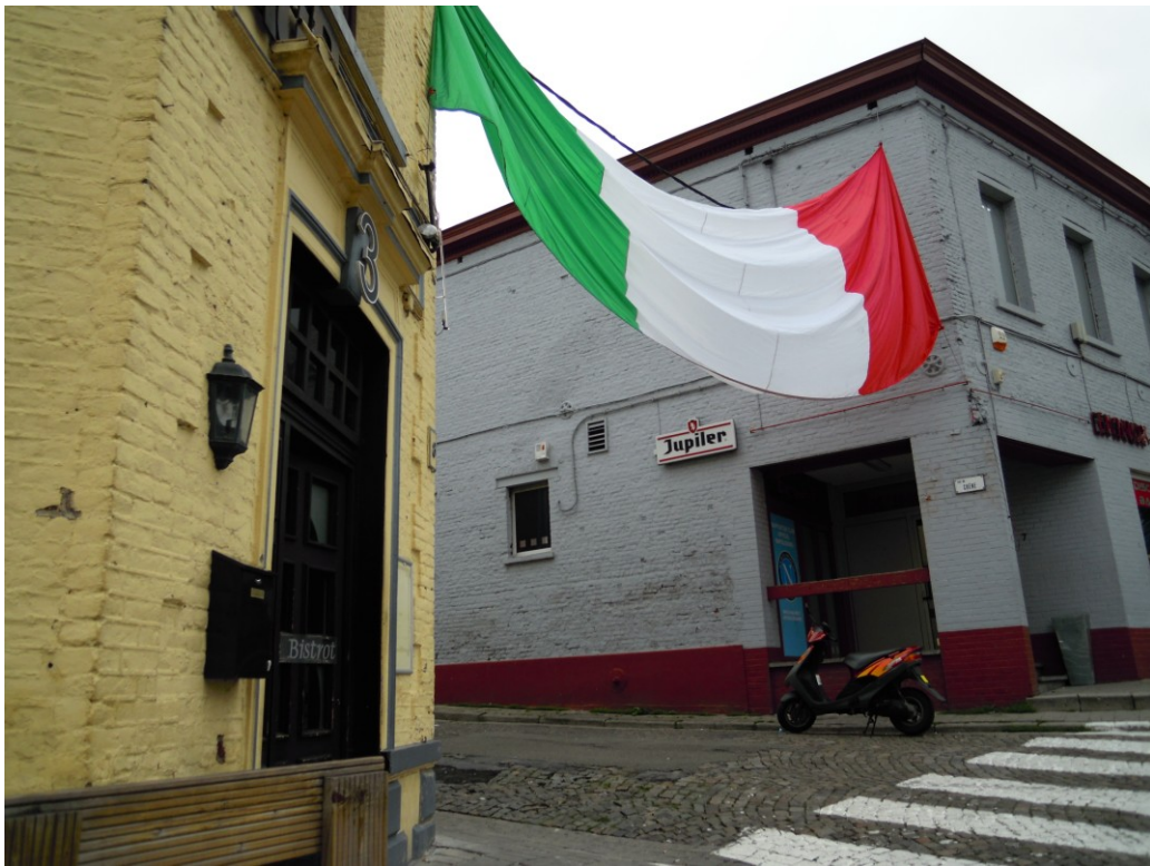
Fig. 5. Piazza principale di Morlanwelz, Giugno 2012.