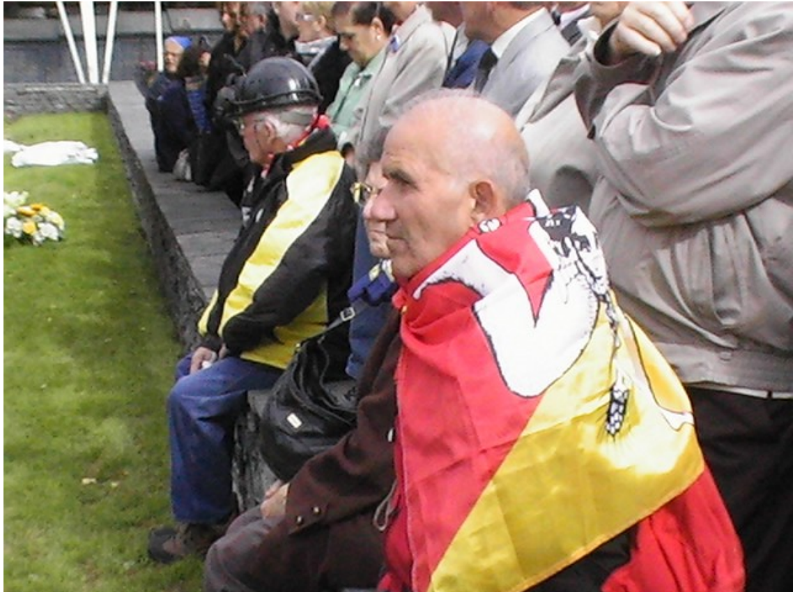
Fig. 16. Commemorazione per la catastrofe di Marcinelle, 8 agosto 2011.