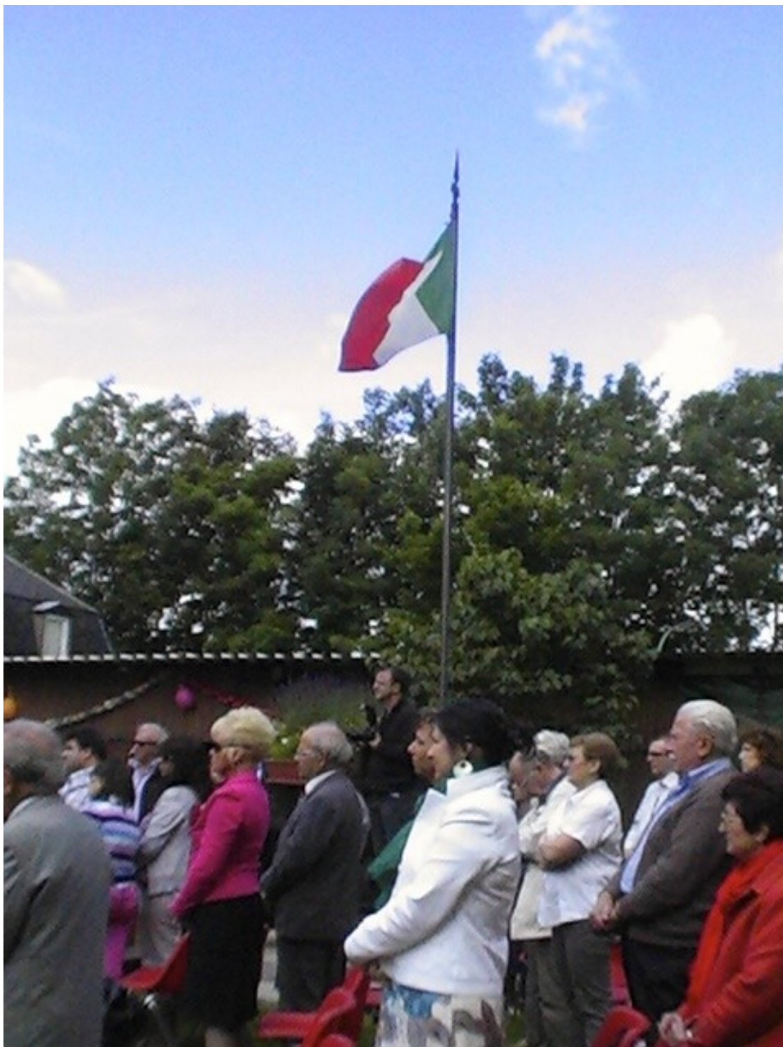
Fig. 11. Centro sociale Cristiano di Roccourt, celebrazione domenicale. Giugno 2012.