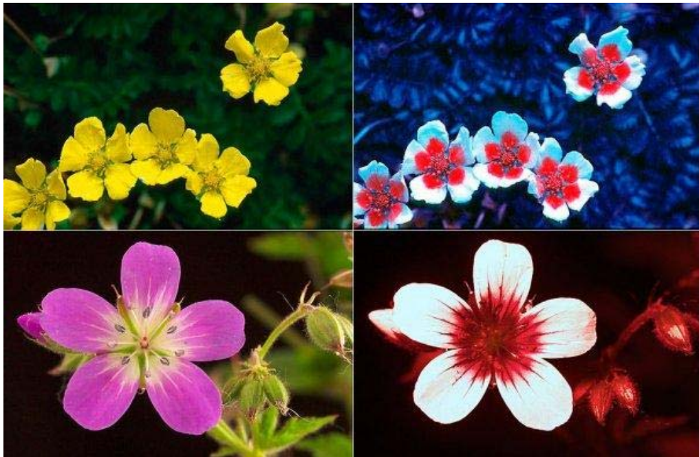
Ecco un esempio di come le condizioni dell'osservazione modificano ciò che conosciamo: a sinistra un cinquefoglie (in alto) e un geranio (in basso) alla luce visibile (percezione umana); a destra gli stessi fiori alla luce ultravioletta (la percezione dell'ape).

La conoscenza è aperta se è ancorata all'esperienza e alla capacità che ha il soggetto di percepire un dato evento o di osservare una specifica situazione. Non si può avere conoscenza senza esperienza, perché l'esperienza medesima modifica la conoscenza e il processo del conoscere. La conoscenza del calore del fuoco o del bruciore di una fiamma avviene nell'istante successivo all'esperienza del calore o del bruciore. L'osservazione riveste una parte decisiva nella conoscenza intelligente. Beninteso, oltre all'osservazione, noi siamo immersi nell'esperienza conoscitiva con tutto il nostro organismo, con tutti i nostri organi di senso, con tutta la nostra capacità percettiva, con la nostra capacità di rielaborare ciò che è stato percepito, di comprenderlo, di ricordarlo. Anzi, la vera esperienza è l'esperienza conoscitiva, in cui entrano anche la memoria e l'immaginazione.