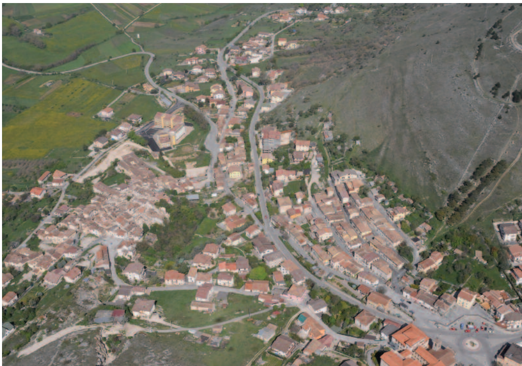
Foto 1 Poggio di Roio. Visibile la netta differenziazione tra il nucleo storico dell'abitato (sulla sinistra) e la parte più recente (sulla destra).

Complessivamente la distribuzione sul territorio di queste tipologie edilizie è risultata molto