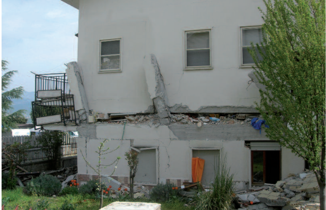
Foto 2 Pianola. Distruzione completa del primo piano.

tempo nell'area corrispondente all'insediamento originario, il grado MCS relativo alla parte più propriamente storica non differisce da quello assegnato all'intero abitato (San'Eusanio Forconese, Onna, Villa Sant'Angelo, Casentino), mentre per altre situazioni la differenza avrebbe oscillato tra 1/2 e 2 gradi. Un caso significativo è quello di Poggio di Roio dove l'intensità relativa al nucleo storico sarebbe incerta fra i gradi X e XI, mentre nella parte di sviluppo più recente sarebbe stimabile intorno al grado VII.