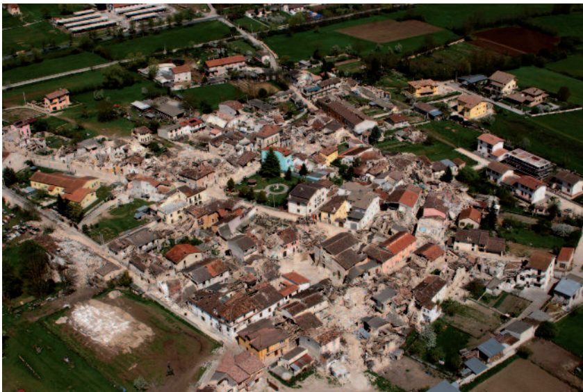
Foto 4 Onna. Foto dall'elicottero.