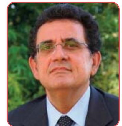
Giovanni Corsello Presidente SIP

Un saluto caloroso di Benvenuto a tutti i congressisti e a tutti i Pediatri Italiani presenti al Congresso. Buon Lavoro.