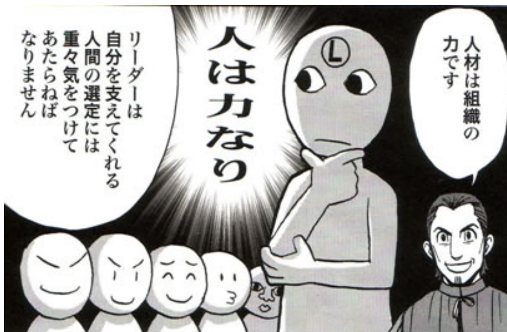
Figura 12: In basso a destra nella tavola compare Machiavelli che lancia ammonimenti al Principe. In questa scena, il leader apprende che le persone dotate di talento possono fornire un supporto determinante per la prosperità del principato.

Questa serie di precetti morali e comportamentali vengono stemperati da una grafica molto buffa, a tratti caricaturale, finalizzata a rendere più intelligibile e di facile approccio il tema generale (Figura 12).