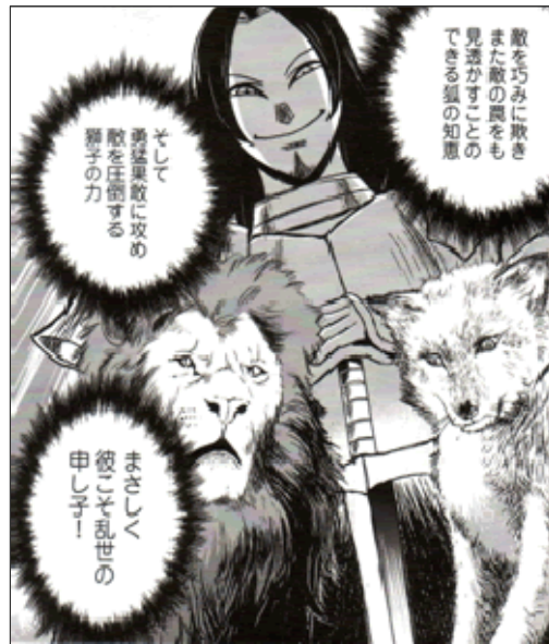
Figura 10: Rappresentazione allegorica delle virtù del Principe: la forza del leone e l'astuzia della volpe. Al centro, Cesare Borgia.

Lo sforzo di fornire un quadro esaustivo delle vicende storiche si contrappone, però, al prevalere di una logica di mercato che, dovendo rivolgersi a un pubblico giapponese poco avvezzo alla storia italiana, favorisce la leggibilità dell'opera condensando, o addirittura omettendo, alcuni momenti chiave. Le ultime pagine del manga, infatti, offrono in tutta fretta al lettore i nuovi scenari politici che nel frattempo si erano delineati intorno al Machiavelli: la disfatta dell'esercito francese, la fuga di Pier Soderini e il rientro a Firenze della famiglia dei Medici, con la conseguente rimozione immediata di Machiavelli dal suo incarico. Lontano dalle lotte di potere, Machiavelli inizia la stesura del Principe , dando