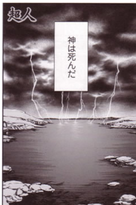
Figura 8: La prima pagina di Così parlò Zarathustra che recita: “Dio è morto”.

Come già accennato a proposito della Commedia , molti titoli della collana della East Press, nel tentativo di rappresentare contesti culturali e temporali molto distanti dal pubblico destinatario, vengono supportati da interpolazioni a scopo didascalico che, per grandi linee, diano un’idea del contesto in cui si ambientano la vita e il pensiero dell’autore, oltre che del sistema valoriale vigente all’epoca. Ne è un esempio la seconda opera che intendiamo analizzare in questa sede, Il Principe di Niccolò Machiavelli, tradotto in giapponese col titolo di Kunshuron (君主論, 2008). Il manga si apre con queste parole, che tentano di offrire al lettore qualche appiglio per meglio comprendere un testo del 1513: