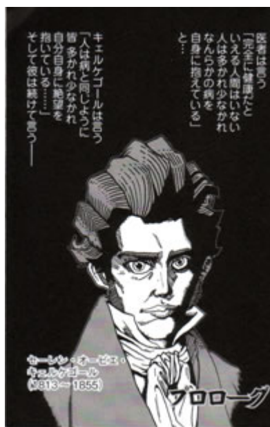
Figura 1: Ritratto di Søren Kierkegaard per il manga tratto da La malattia mortale .

Prima di procedere, però, è necessario spendere qualche parola sulla linea editoriale