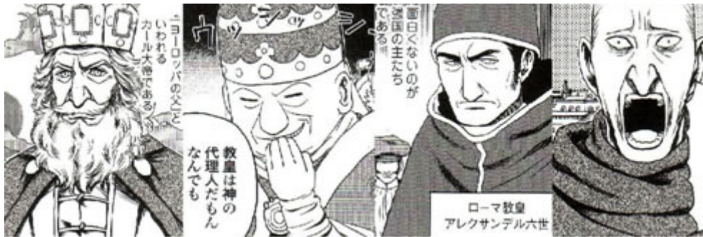
Figura 9: Da sinistra verso destra: Carlo Magno, Papa Leone III, Papa Alessandro VI, Girolamo Savonarola.

Immediatamente dopo, il focus si sposta su un giovane Machiavelli, prima alle prese con gli scontri tra Firenze e Pisa, poi in veste di mediatore tra Firenze e la Francia. Molto simile a una cronistoria, il manga si addentra, pagina dopo pagina, in una descrizione, dettagliata e a tratti pedante, ma stemperata da una grafica spesso parodistica, delle vicende che coinvolgono anche Cesare Borgia, ammantato da un alone di crudeltà e mistero. Dopo averlo conosciuto, Machiavelli rintraccia nella sua figura le caratteristiche essenziali per un leader: l'astuzia tipica di una volpe e la forza di un leone (Figura 10) 12 . In seguito, come le vicende storiche ci insegnano, con la morte di papa Alessandro VI inizia anche il lento declino di Cesare Borgia, conclusosi con una morte prematura a soli trentadue anni, dopo che il nuovo pontefice, Giulio II, ne aveva ordinato l'arresto.