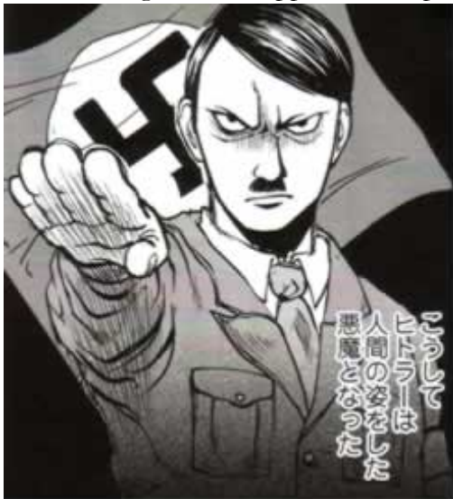
Figura 2: Un'immagine di Adolf Hitler tratta da Waga Tōsō .

La Divina Commedia (神曲, Shinkyoku , 2008), ad esempio, viene incredibilmente condensata in meno di duecento pagine in cui la lettura procede spedita, dall'Inferno al Paradiso, in base a un processo di semplificazione della trama e di alleggerimento dei contesti sociali: fattori senza i quali verrebbe meno la leggibilità, condicio sine qua non imprescindibile di questa collana. Lo stesso procedimento è ugualmente applicato ad opere come l' Introduzione alla Psicoanalisi (精神分析入門, Seishin Bunseki Nyūmon ) e L'interpretazione dei sogni (夢判断, Yume Handan ) di Sigmund Freud, o addirittura per il Mein Kampf (わが闘争, Waga Tōsō ) di Adolf Hitler: le prime due, raccolte in un unico volume, raccontano l'approccio di un giovane Freud allo studio delle malattie della psiche, mentre il secondo ripropone, con una semplificazione che lascia francamente perplessi, l'infanzia di Hitler fino alla sua ascesa politica culminata con lo sterminio degli ebrei (Figura 2). Insomma, più che proporre uno studio su un'opera, o meglio una sua rilettura, molti di questi