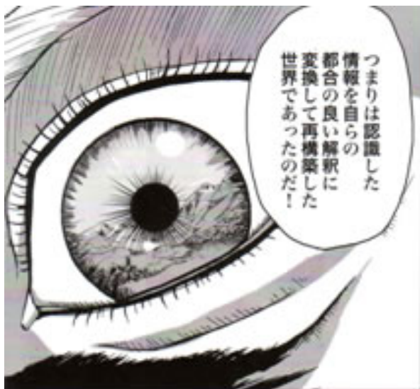
Figura 5: Il prete ha rivelato a Fritz la verità sul mondo: «In pratica, un mondo ricostruito manipolando le conoscenze acquisite secondo un'interpretazione di comodo», recita la vignetta. Da Nigentekina, amari ningentekina .

In quel momento, il prete si congratula con lui e, assumendo le fattezze di Nietzsche, gli dice: