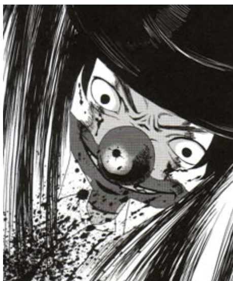
Figura 7: Il Pagliaccio da Così parlò Zarathustra .