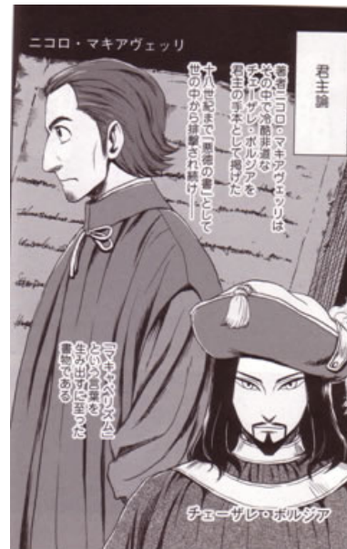
Figura 11: Machiavelli e Cesare Borgia dalle pagine de Il Principe .

L'intento didascalico del manga è palese: in molte occasioni il racconto, narrato spesso da una voce fuori campo, introduce digressioni che, alla stregua di un manuale di storia, propongono continui quesiti al lettore, accompagnandolo nella sua lettura con interventi diretti come: «Proviamo a dare un'occhiata al contesto che ha permesso a Machiavelli di scrivere Il Principe » 14 . Proprio le ultime pagine cercano di spiegare il contenuto dell'opera, che come è noto si presenta originariamente in forma di un trattato in ventisei capitoli accompagnati da una dedica, ed è qui sintetizzato in una serie di vignette in cui il “leader ideale” – diventato nel manga un anonimo omino bianco con la lettera “L” di leader stampata in fronte – si presta come attore sulla scena. Leggiamone qualche pagina: