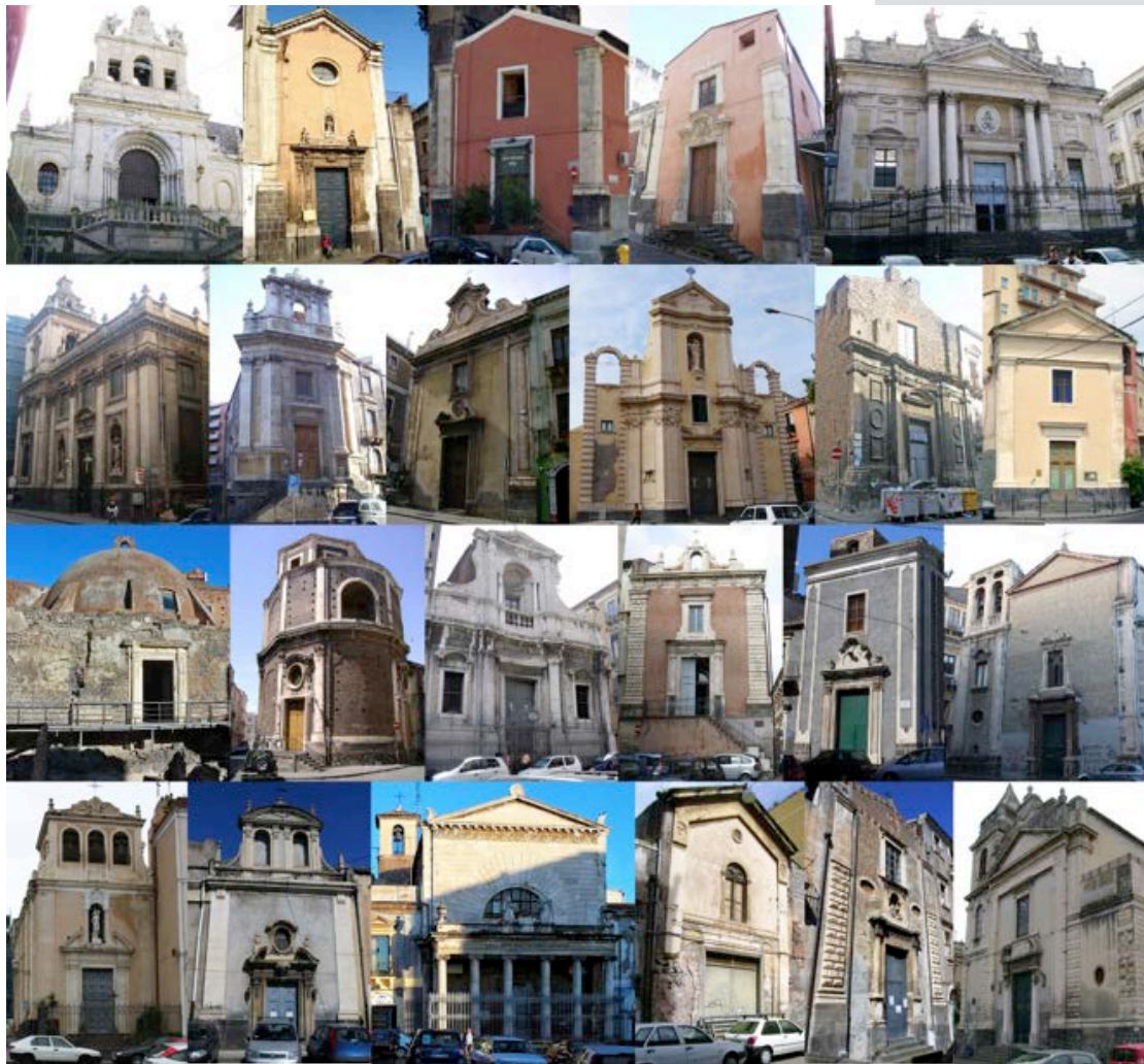
Figure 1. The facades of the twenty-three single hall churches in Catania. On the top, from left to right: S. Agata al Carcere, S. Agata alle Sciare, S. Antonio Abate, S. Barbara, S. Biagio, S. Caterina al Rinazzo, S. Cristoforo Minore, S. Giuseppe al Duomo, S. Giuseppe al Transito, S. Maria della Palma, S. Maria della Consolazione al Borgo, S. Maria della Rotonda, S. Maria dell'Ogninella, S. Martino dei Bianchi, S. Michele Minore, S. Nicolò al Borgo, S. Orsola, S. Sebastiano, S. Vito, SS. Crocifisso di Majorana, SS. Elena e Costantino, SS. Sacramento al Borgo, SS. Sacramento al Duomo.

complesso termale di epoca romana, e due casi in cui i templi sono stati ridestinati al culto: quello ortodosso per la locale comunità rumena presso la chiesa di S. Cristoforo Minore e quello cattolico per la comunità cingalese nella chiesa di S. Maria dell'Ogninella [5]. Dal punto di vista tipologico queste fabbriche tradizionali hanno caratteristiche simili. La navata unica, sormontata da una volta a botte lunettata, è generalmente conclusa da un'abside semicircolare chiusa superiormente da un catino emisferico. Le superfici utili delle aule oscillano tra gli 85 ed i 280 metri quadrati, alle quali vanno poi sommate le piccole superfici costituite dagli ambienti di servizio annessi che sono presenti in gran parte delle chiese analizzate. Per il riconoscimento delle caratteristiche tecnico-costruttive si è proceduto al rilievo di tutti gli elementi di fabbrica. In particolare, si è riscontrato che le chiusure verticali, di spessore variabile tra 60 e 160 centimetri, sono formate da murature portanti in blocchi informi o sbazzati di basalto lavico e malta di calce