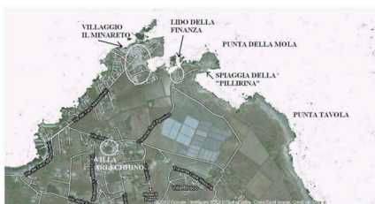
LA PILLIRINA ADESSO