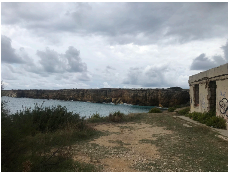
Fig. 3. L'area della Pillirina.

Le “Varianti della Bellezza” non entreranno mai in vigore, approvate in Comune furono respinte dagli organi regionali poiché non indicavano aree di pari estensione da dedicare allo sviluppo turistico, rispetto a quelle sottoposte a vincolo, ed erano state approvate in assenza della VAS (Valutazione Ambientale Strategica) 17 (Giornale di Sicilia 2016). Venne invece avviato, in seguito alle battaglie e alla mobilitazione di SOS Siracusa, l’iter di costituzione della