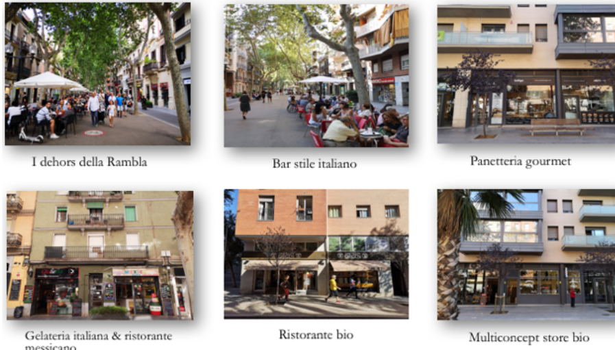
Fig. 2 - I paesaggi del consumo di Poblenou