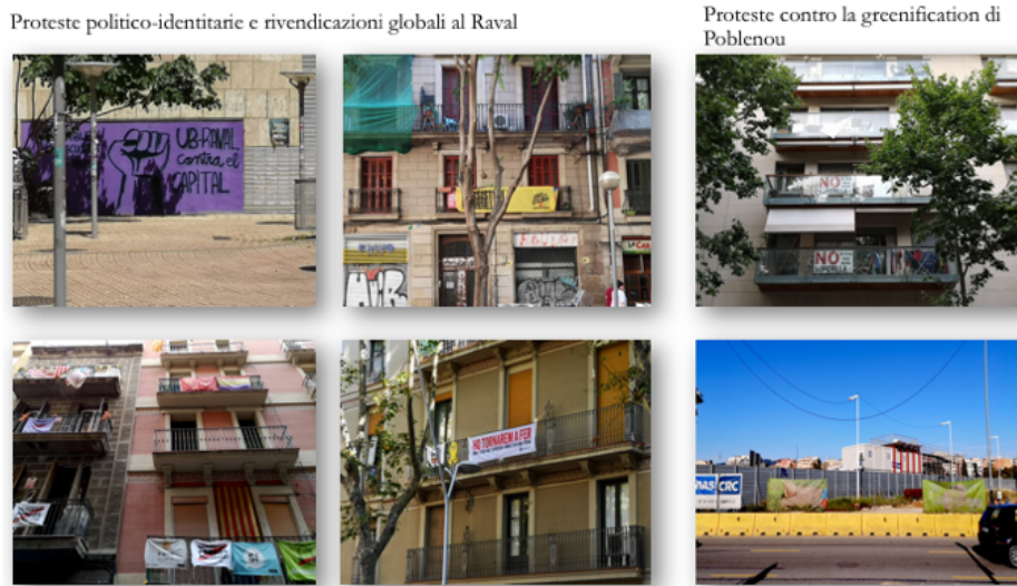
Fig. 5 - La protesta contro le superillas al Poblenou