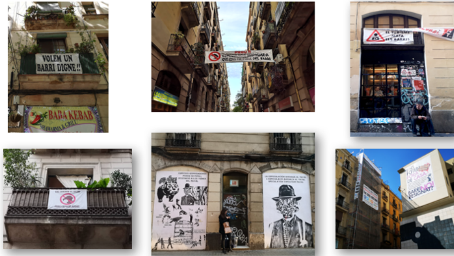
Fig. 4 - La protesta contro la gentrificazione turistica al Raval

contro forme di fruizione turistica non residenziale che snaturerebbero l'identità complessa e stratificata delle comunità che vi abitano.