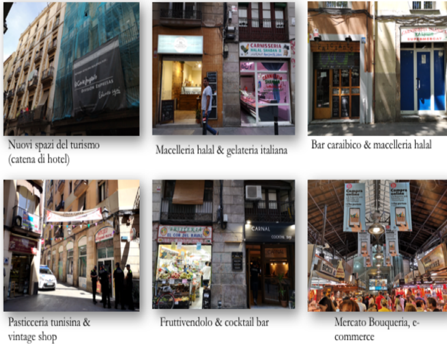
Fig. 1 - I paesaggi del consumo del Raval