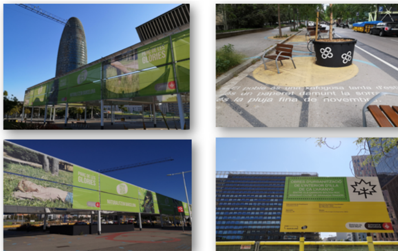
Fig. 3 – “Naturalizem Barcelona”