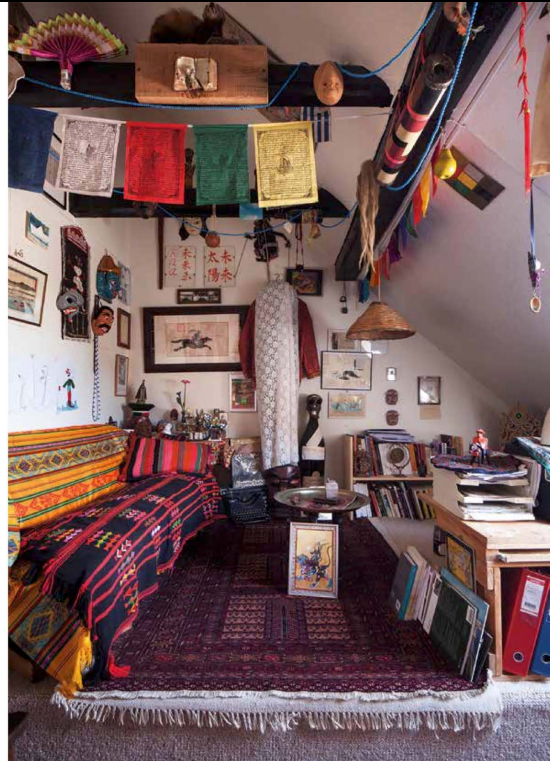
Fig. 7 Eugenio Barba, Francesco Galli e Julia Varley, Genius Loci. La casa dell'Odin Teatret , Holstebro, Odin Teatrets Forlag, 2020, pp. 130-131, fotografie di Francesco Galli, l'ufficio di Eugenio