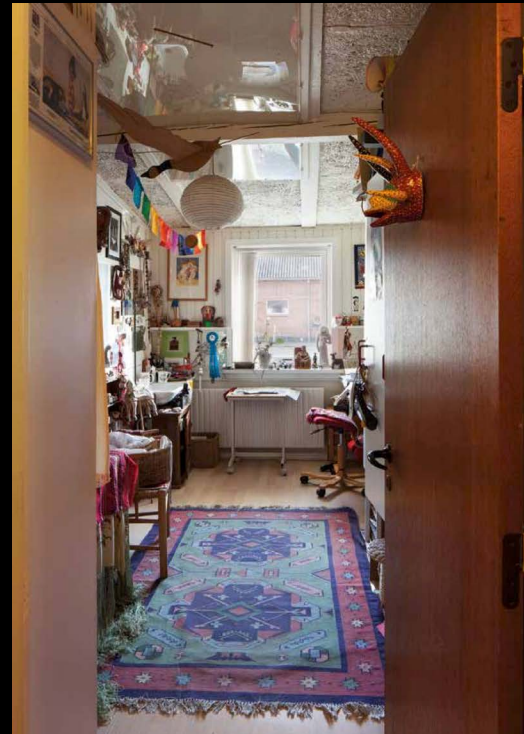
Fig. 5 Eugenio Barba, Francesco Galli e Julia Varley, Genius Loci. La casa dell'Odin Teatret , Holstebro, Odin Teatrets Forlag, 2020, pp. 75-75, fotografia di Francesco Galli, la sala Rossa durante un seminario