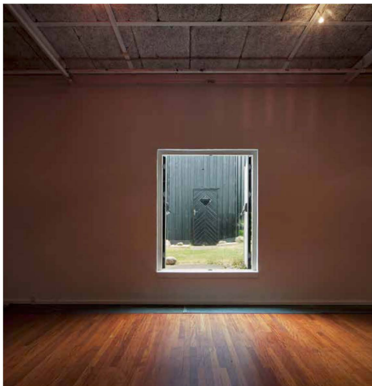
L'uscita di sicurezza della sala Bianca fronteggia la torre di Sanjukta.