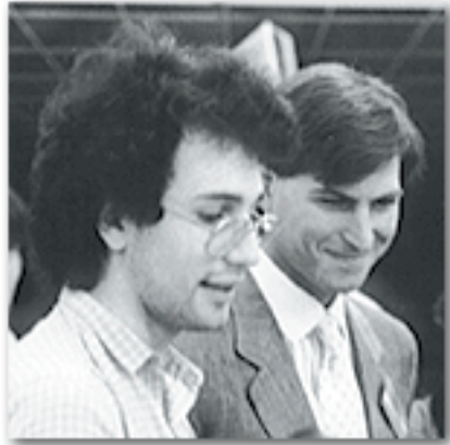
Figura 2 - Un giovanissimo Laurent Ribardiere accanto ad un altrettanto giovane Steve Jobs

Nato su Macintosh, 4D è disponibile dal 1993 anche su Windows; oltre al motore del database include anche la gestione dell'interfaccia e un linguaggio con molti comandi e la possibilità di plugin esterni per aggiungere funzionalità (videoscrittura, fogli di calcolo, editor di immagini, ecc.).