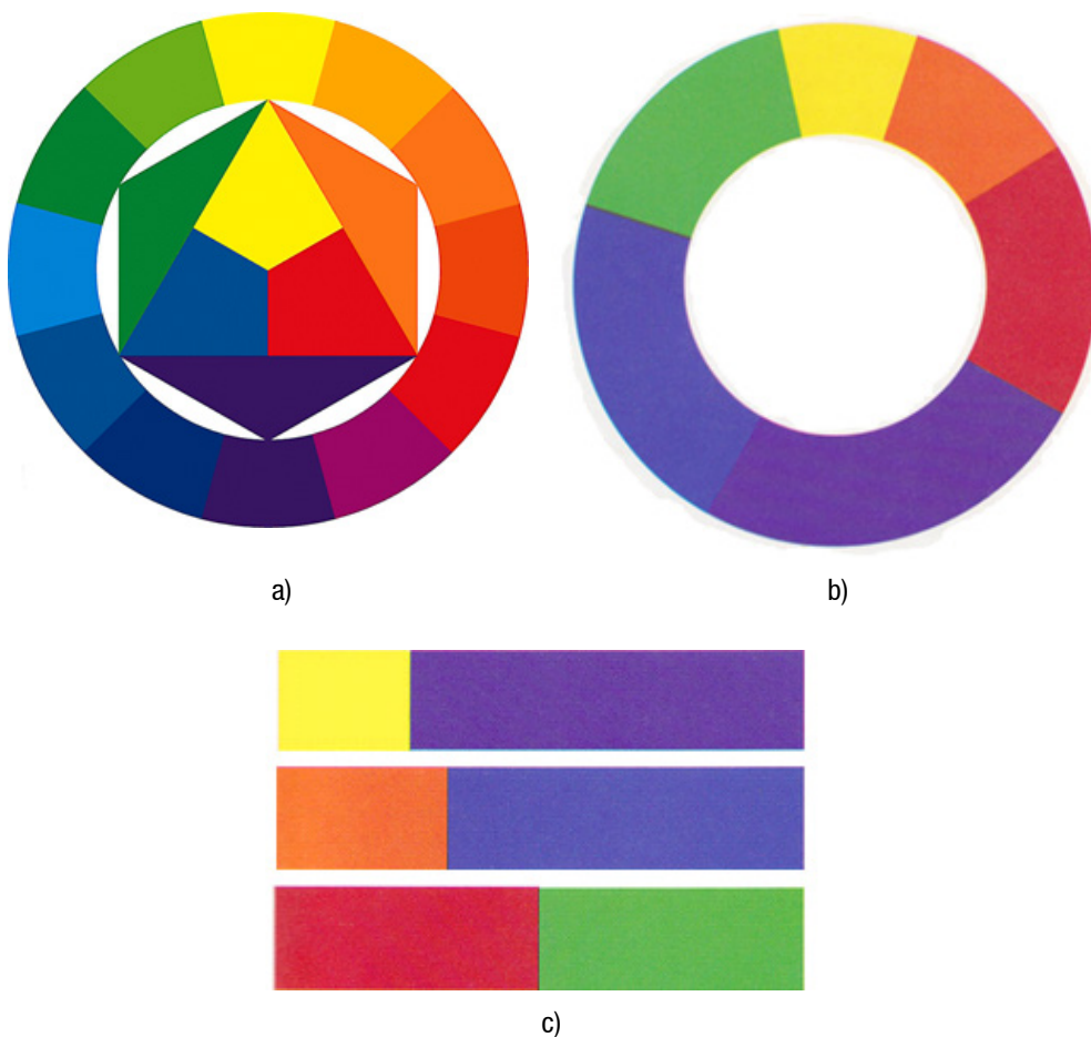
Figure 1 - (a) Itten's chromatic disc; (b) Itten's disc with the harmonious quantity values; (c) relationships between the harmonious values and the related complementary ones.